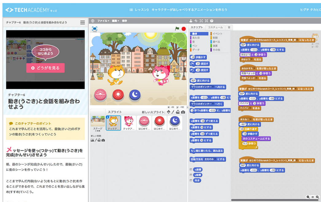
TechAcademy キッズの学習画面

TechAcademy キッズでは、マサチューセッツ工科大学メディアラボが開発したプログラミング学習ソフト「Scratch」を利用して学習いたします。Scratch はビジュアルプログラミング言語と呼ばれるプログラミング言語の1つで、難しい操作やタイピングは不要とし、ゲーム感覚で楽しみながら学ぶことができます。また今後は、Web アプリケーションやスマートフォンアプリ、ゲーム開発等、子どもたちがステップアップしてプログラミングを学べるよう学習教材の提供をしてまいります。