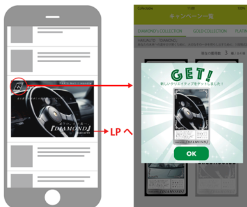
① デジタル広告を集める