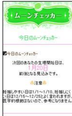
「生理日予測ツール」

最大 12 回の生理日履歴を元に予測するため、周期の変動なども含めた精度の高い予測が可能です。また、メールアドレスを登録しているユーザーに対しては、生理開始予定日の 3 日前および 7 日前にメールを送り、注意を促します。