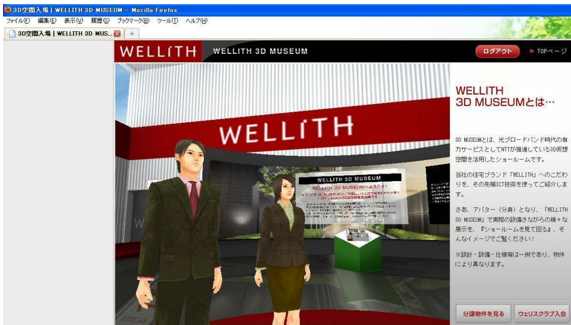
WELLITH 3D MUSEUM 入り口