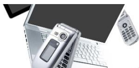
マルチデバイス対応

ngi Ad Platform はネット広告の広告効果を一括で測定し、かつ広告効果を向上させるためのツールです。