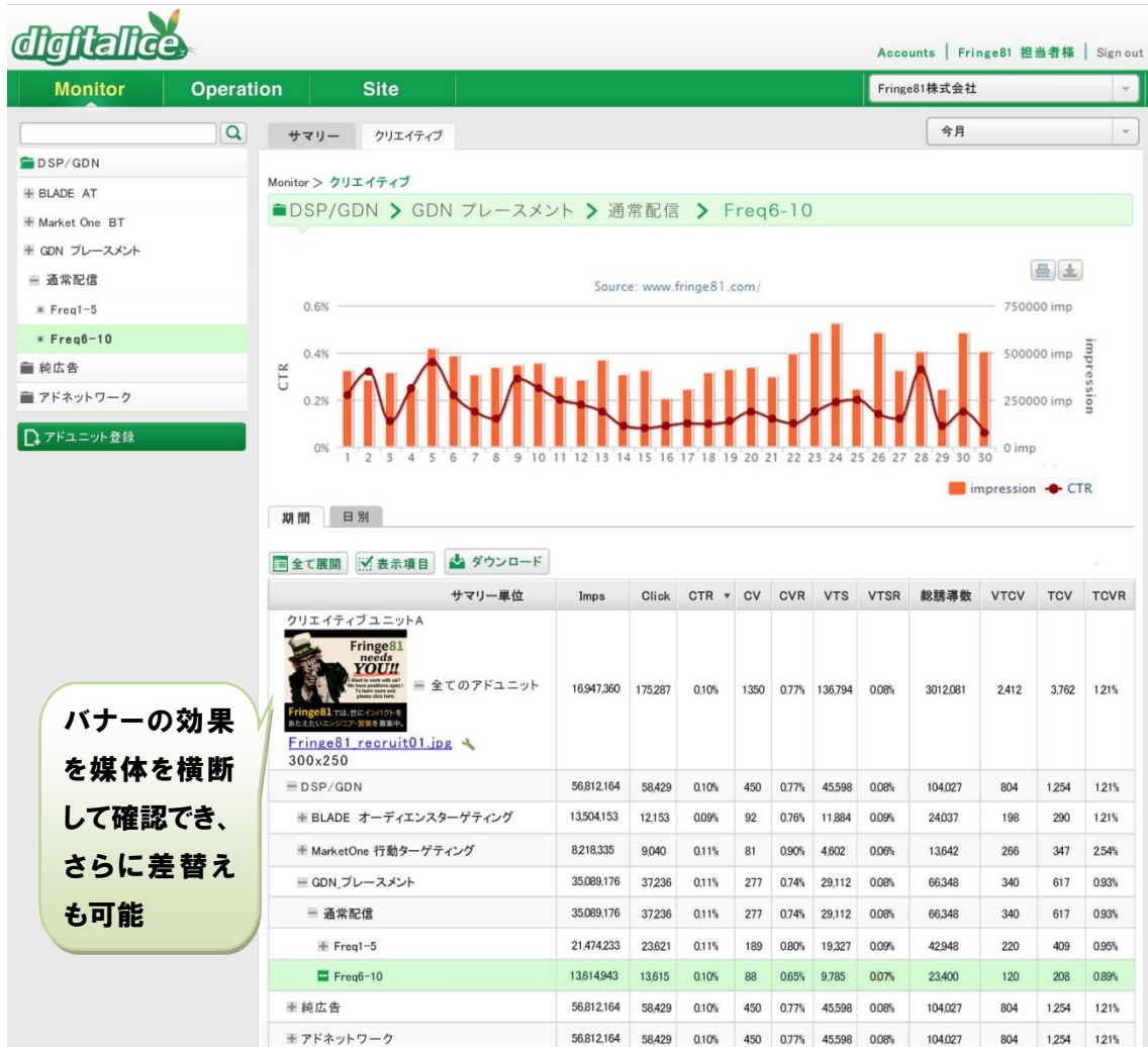
図 1: デジタルリス モニタ

広告主または広告代理店はどのバナーがどのくらい配信され進捗しているか(インプレッション数)、クリックスルーレートはどのくらい出ているのか、コンバージョン数はいくつか、バナーを閲覧した後に検索エンジン経由で広告主サイトに誘導された数はいくつか、といったバナー広告にまつわる効果指標をリアルタイムに、ひとつの画面で横断して管理することが可能となります。