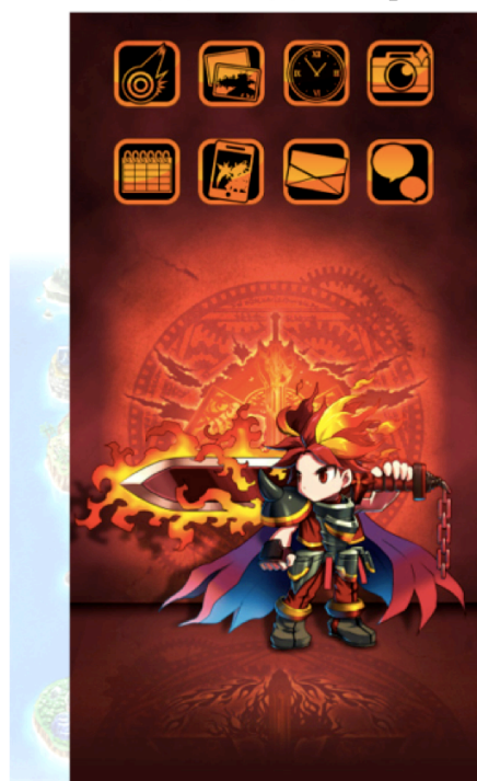
タイプA「ヴァルガス」